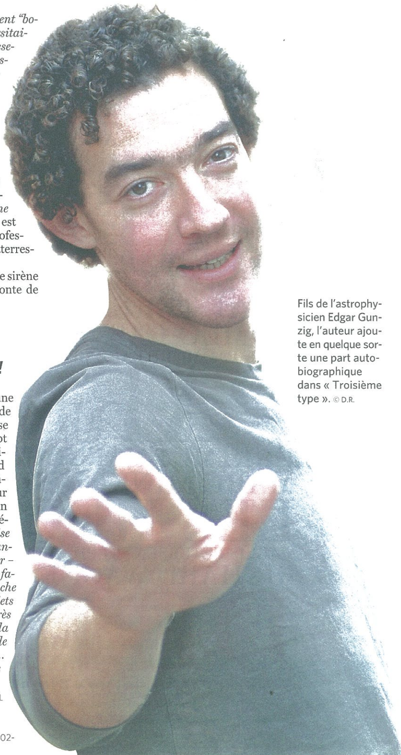
Fils de l'astrophysicien Edgard Gunzig, l'auteur ajoute en quelque sorte une part autobiographique dans « Troisième type ».

L'adolescente finira petite sirène terroriste au Festival du conte de Chine.