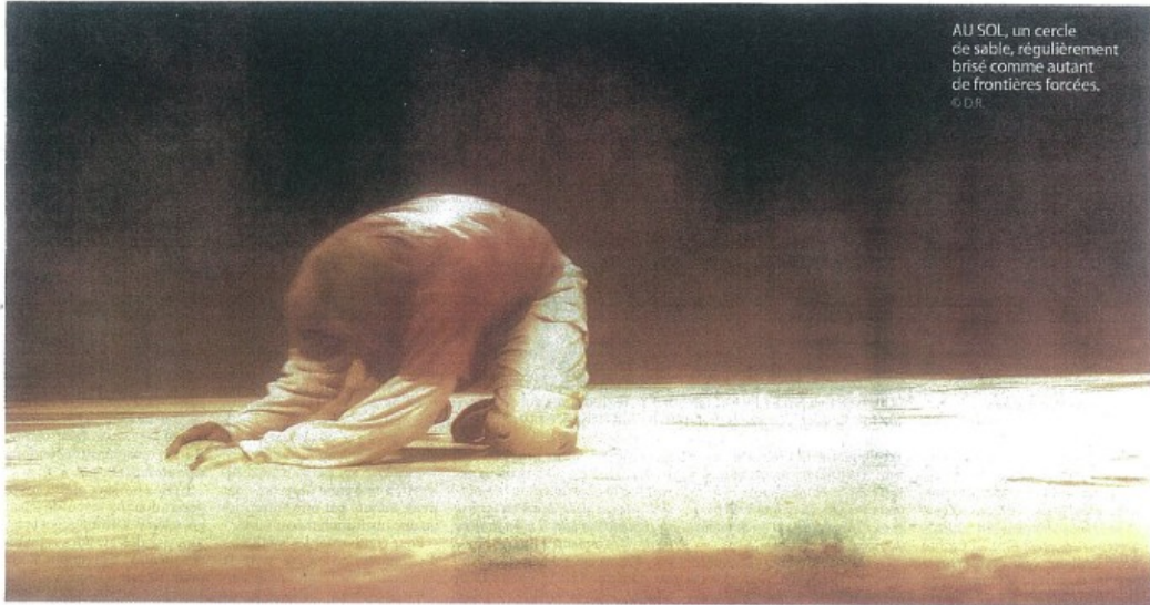
AU SOL, un cercle de sable, régulièrement brisé comme autant de frontières forcées.

CRITIQUE Sur le plateau du Théâtre de Poche trône une énorme boule en toile de jute, évoquant soit un globe terrestre cousu à la main, soit un grand sac qui contiendrait toute une vie. Sublime entrée en matière pour Un homme est un homme , projet de