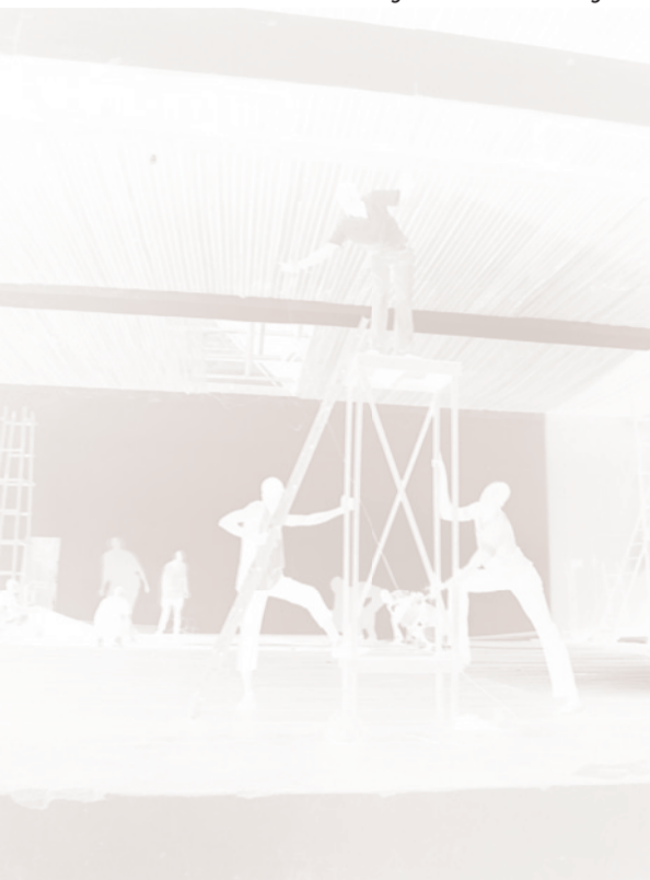
Aménagement de la salle Ngoma.

tant d'autres des guerres récentes, le toit de l'Espace NGoma est percé par l'impact d'une roquette.